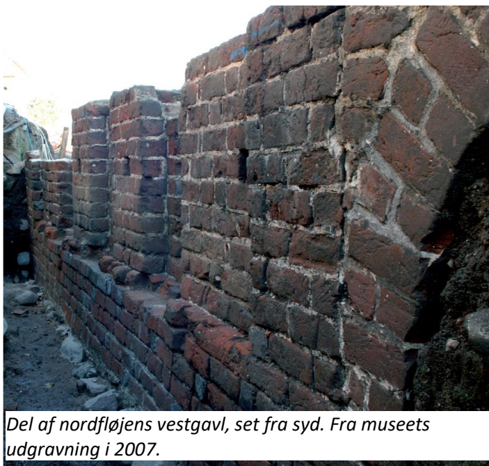
Del af nordfløjens vestgavl, set fra syd. Fra museets udgravning i 2007.