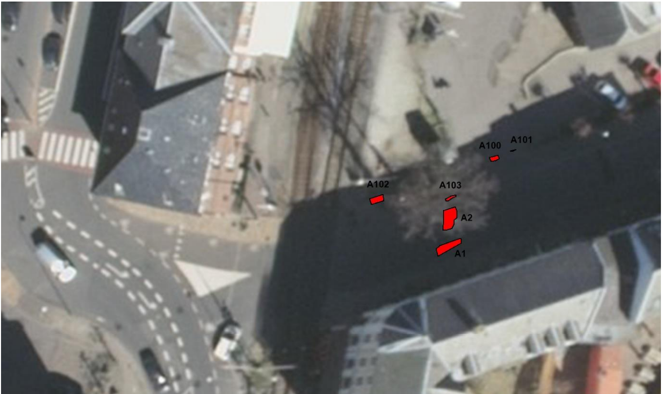
Oversigtskort over registrerede anlæg i Frederiksgade. Banelegemet og banegården ses vest for anlæggene.

Arkæologi Sydfyn, Svendborg Museum d. 28-05-2020