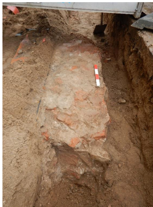
A1 påtruffet ud for Frederiksgade 17. Muligvis en del af klosterkirkens sydmur. Set fra øst.

i røde munkesten, ca. 60 cm langt, og omgivet af nedbrydningslaget fra selve kirken (F5297-99). Murværket er kun synligt i den sydvendte profil under vejkannten. A102 udgør en murrest på mindst 2 skifter i højden, og mål på ca. 70x40 cm i et øst-vest gående forløb. Murværket består af regulære munkesten med mørtel mellem skifterne (F5300-05). A103 var kun synlig i fladen i en enkelt munkestensbredde, og ca. 1 m. i længden (F5315-19). A1 er påtruffet 2 m ud for indgangen til Frederiksgade 17, og består af et 2 m langt, og 65 cm bredt, øst-vest gående murværksforløb i regulære munkesten. Murværket er mindst 5 skifter højt, og bunden er ikke konstateret ved overvågningen. Det er muligvis en del af kirkens indermur, da det ikke er opmuret særligt nøjagtigt. Efter endt registrering er der pålagt fiberdug over murværket, forud for støbning af nye kantsten, for at sikre det for eftertiden (F5322-26, F5330). A2 er påtruffet i midten af vejen, nord for A1 og syd for A103 (F5341-5354). Anlægget er kun fritlagt i overfladen, og det er derfor ikke muligt at afgøre, om der er tale om en del af kirkens østlige gavl, eller en rest af korets gulv. 2 parallelle, skråtliggende rækker af røde teglsten (F5351) indikerer muligvis et decorationselement i en gulvoverflade. Det er meget sandsynligt at alle de nævnte anlæg er blevet udgravet og registreret ved de foregående, mere dybdegående arkæologiske undersøgelser.