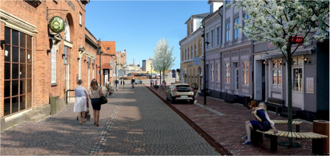
Illustration over Frederiksgade efter byfornyelsen.