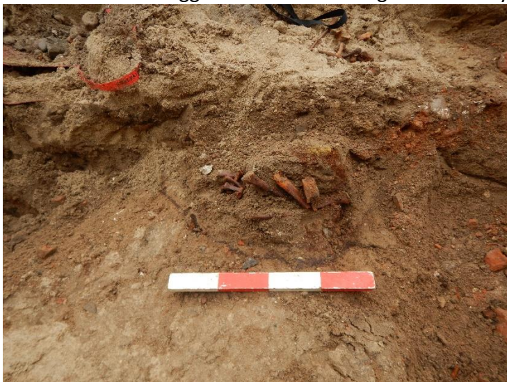
Forstyrret begravelse oprindeligt placeret under klosterkirkens gulv. X2, set fra syd.

Ved fremtidige jordarbejder i Frederiksgade, og i de øvrige omkringliggende områder vil Svendborg Museum som udgangspunkt altid anbefale en arkæologisk forundersøgelse, da lokaliteten delvist ligger inden for fredningszonen for byens franciskanerkloster, som ligger under-